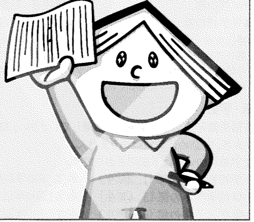
青少年読書感想文全国コンクール イメージキャラクター「おほんちゃん」

公式ホームページ = https://www.dokusyokansoubun.jp